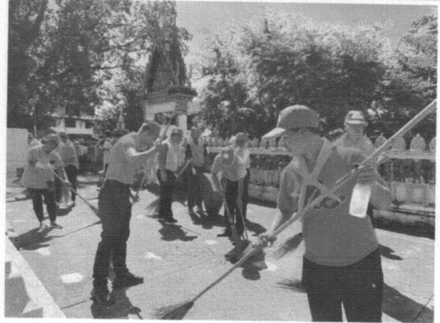
กิจกรรมจิตอาสาเทิดพระเกียรติพระบาทสมเด็จพระบรมชนกาธิเบศรมหาภูมิพลอดุลยเดชมหาราช บรมนาถบพิตร เนื่องในวันนวมินทรมหาราช ๑๓ ตุลาคม ๒๕๖๖